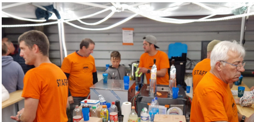
L'équipe buvette n'a pas chômé tout au long de la soirée

Rendez vous est d'ores et déjà pris pour une deuxième édition en 2025 !