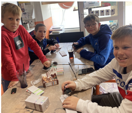
Opération "tamponnage" des tickets pour quelques jeunes Cadets