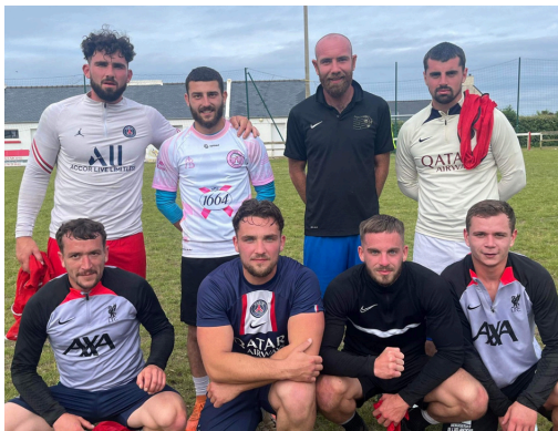
L'équipe Vainqueur "Les Furieux"

Rendez-vous est d'ores et déjà pris pour 2025. Avant cela, les Cadets seront présents à la fête du sport ce samedi 29 juin de 10h à 12h au complexe sportif ainsi qu'au forum des associations le samedi 7 septembre prochain. Pour contacter les Cadets : 02 98 72 39 23