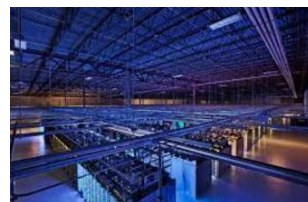
Un data center vu de l'intérieur