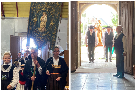
1. La journée a commencé par la messe en breton avec l'arrivée de la bannière et du saint.