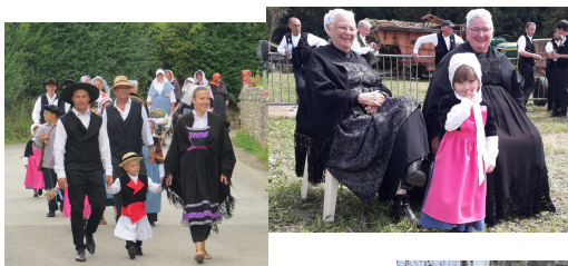
3. Tous les âges se mêlaient.