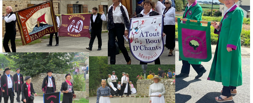
2. Les différents bagads, cercles, anciens tracteurs et confréries ont ensuite défilé pour arriver sur le site de la Chapelle de Prat Coulm.