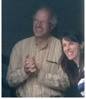
Nos 2 pianistes à la fenêtre

Le jeudi 13 juillet à 18h, un prélude musical a été donné en plein air rue de Mesméniou. L'objectif de réunir les habitants du quartier et de faire connaissance a été atteint puisque de nombreuses personnes du quartier étaient présentes.