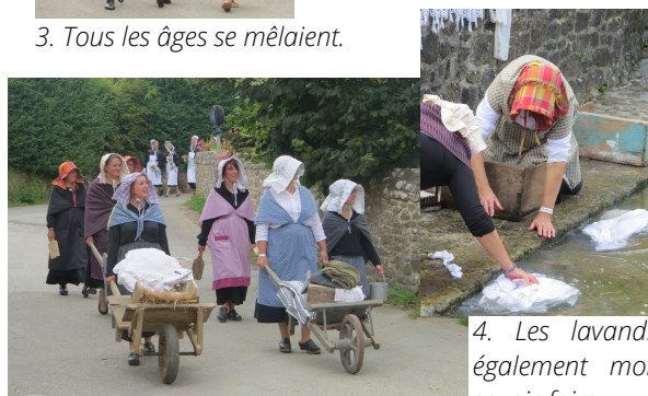
4. Les lavandières ont également montré leur savoir-faire.