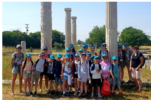
Les élèves posent devant le site archéologique de Pella & Vergina