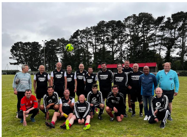
Photo d'équipe des anciens Cadets qui se sont opposés, avec joie et talent, aux Cadets actuels.

La photo d'équipe de tous les Cadets, actuels et anciens.