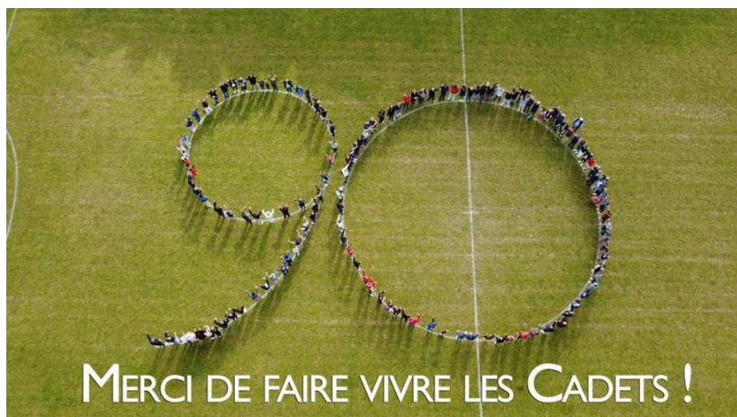
90 ans vus d'en haut.