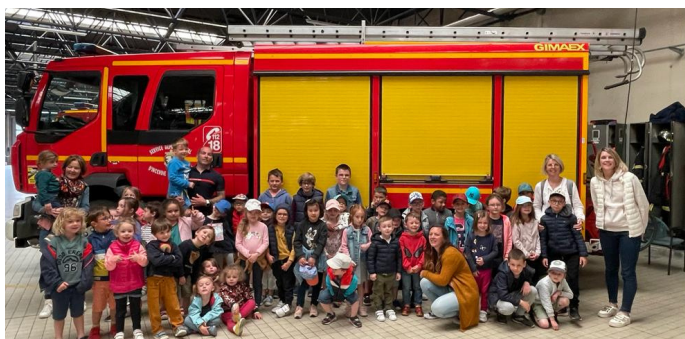
Les élèves posent devant le camion de pompier