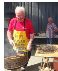
Grillades au menu !

Le vendredi 23 juin, le club de pétanque, qui compte 83 adhérents, a fait son repas annuel dans une bonne ambiance.